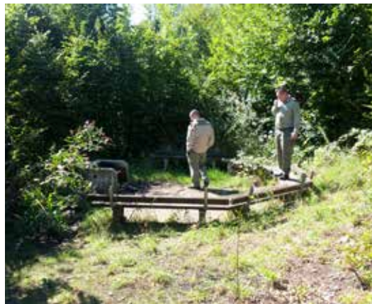
Schadenplatz 3: Für Grill Liebhaber