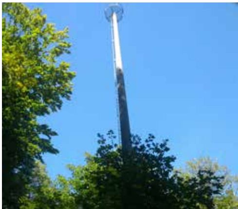
Schadenplatz 1: Das grosse Abreissen