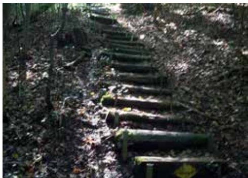
Schadenplatz 2: Für den gemütlichen Wald Spaziergang