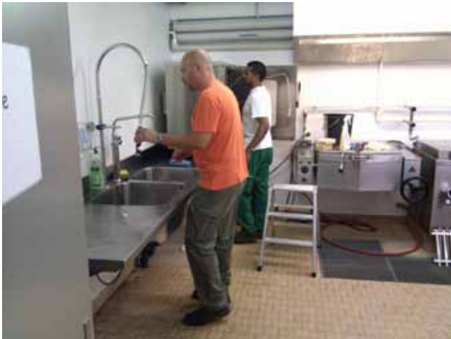
Die Küchenmannschaft bei der Grossreinigung vor dem Ansturm!