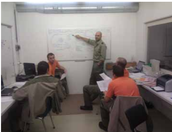
Die Führungsuntersützung trifft die letzten Vorbereitungen