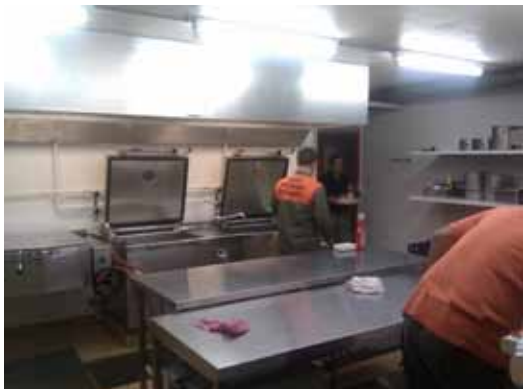
Die Küche wird wieder auf Vordermann gebracht.