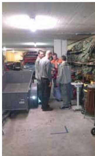
Kontrolle vom Chef persönlich