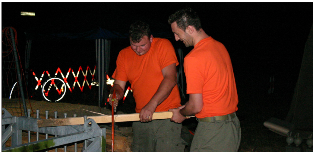
Ruhe vor dem Sturm: Impressionen aus der P+R-Anlage in der Nacht auf Dienstag.

Ausgabe Nr. 3 Mittwoch, 25. Juni 2008 www.altenberg.ch