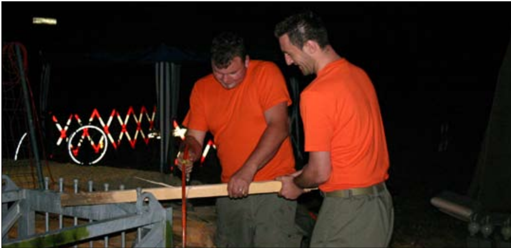
Ruhe vor dem Sturm: Impressionen aus der P+R-Anlage in der Nacht auf Dienstag.

Ausgabe Nr. 3 Mittwoch, 25. Juni 2008 www.altenberg.ch